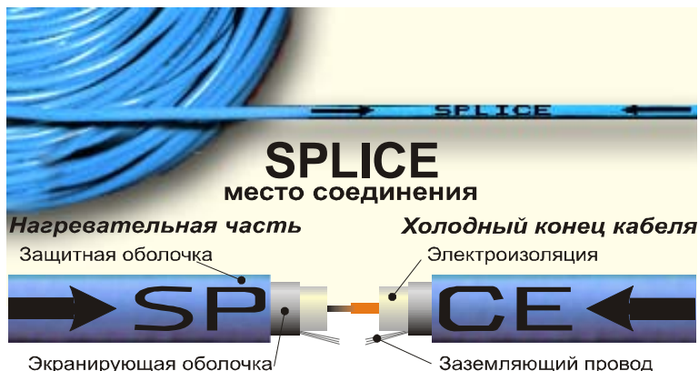
Рис.1. Конструкция одножильного нагревательного кабеля TXLP/1 и устройство соединительной муфты SPLICE